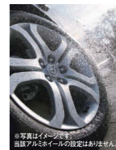
※写真はイメージです。当該アルミホイールの設定はありません。

Noxudol® 長期間に渡り、愛車をサビから守る、 防錆アンダーコーティング。 柔軟性のある厚膜のアンダーコートと、内部の合わせ目・隙間に深く浸透する防錆剤による「2層防錆」で、長期間に渡り、愛車をサビから守ります。愛車に長く乗られる方、スキーやマリンスポーツを楽しまれる方、高速道路を頻繁に利用される方などにお勧めです。 [施工部位:下回り、下回り中空部、足回り] 119 防錆アンダーコーティング ※写真は施行例です。当該車両とは異なります。 ※一部取り扱っていない販売店もございます。 ※Noxudol®はオーソンの登録商標です。