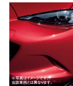
※写真はイメージです。当該車両とは異なります。

きらめくような美しい輝き。簡単メンテでボディはいつもピカピカ。 ボディコーティング MGシリーズ こんな におすすめ! ●ワックスは面倒だけど、お車の外観をキレイに保ちたい方 ●新車時の光沢と、水のはじき性能を保ちたい方 ●洗車をもっと簡単に済ませたいとお考えの方 ●屋根のない駐車場によく駐車される方 ガラス系コーティング被膜が、新車時の光沢と艶を長持ちさせ、お手入れもラクになります。メンテナンスキット付。洗車機使用可(濃色車はブラシ傷が目立ちますので、手洗い洗車をおすすめします)。 94 ボディコーティング MGシリーズ