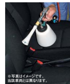
※写真はイメージです。当該車両とは異なります。

美しさは足元から。 ホイールコーティング GOLD 特殊コーティング剤の使用で、ホイールを汚れから守ります。親水効果によって、汚れは水洗い程度でキレイに。機能保持約3年。 95 ホイールコーティング GOLD