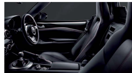
※写真はイメージです。当該車両とは異なります。