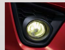
43 スーパーイエロービーム(フォグランプ) ※写真はイメージです。当該車とは異なります。