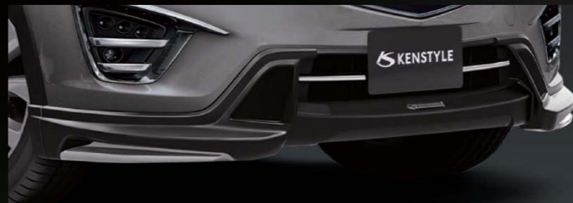
15 [KENSTYLE] フロントアンダーガーニッシュ