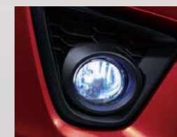
42 スーパーブルービーム(フォグランプ) ※写真はイメージです。当該車とは異なります。