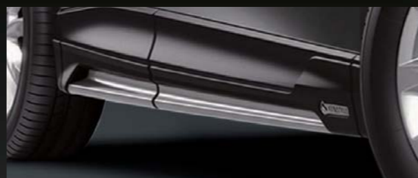
16 [KENSTYLE] サイドアンダーガーニッシュ