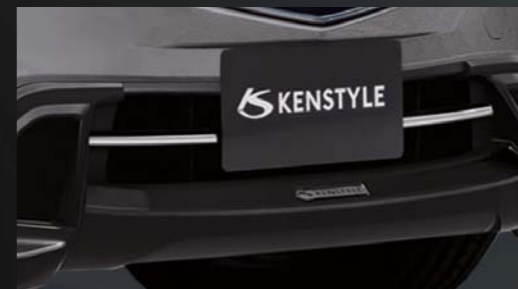
11 [KENSTYLE] フロントバンパーフィン