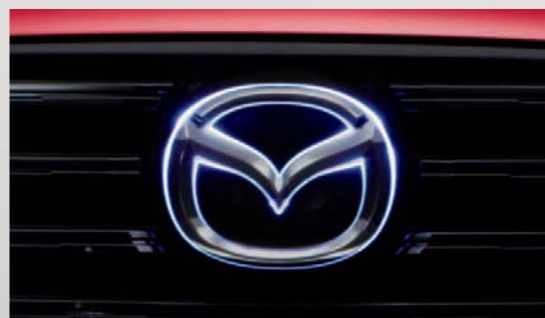
37 エンブレマイルミネーション フロントのマツダブランドシンボルがスモールライトと連動して発光。照明色:ホワイト