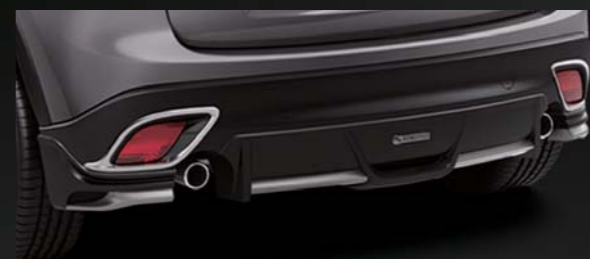
17 [KENSTYLE] リアアンダーガーニッシュ