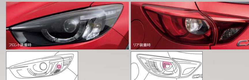
39 ウィンカーバルブ(シルバー)