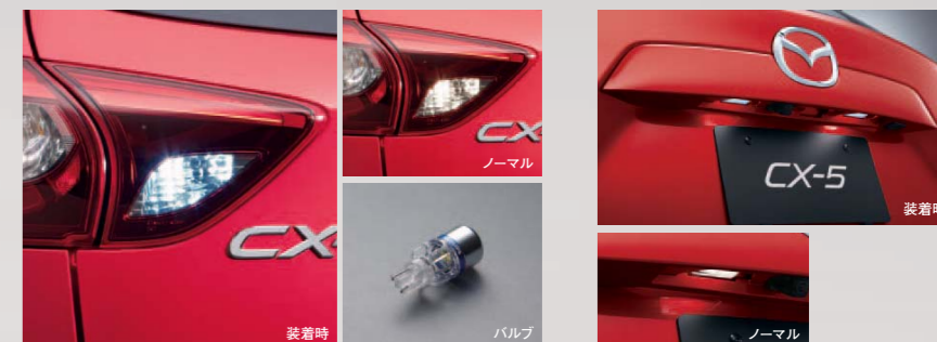
40 LEDバルブ(バックランプ)