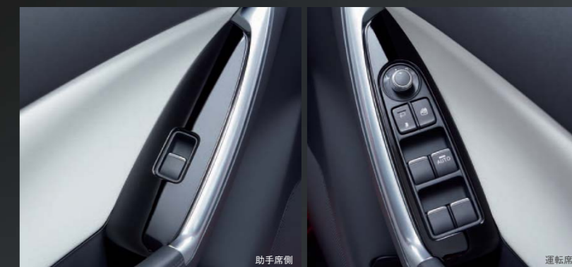
2 [DAMD] ドアスイッチパネル