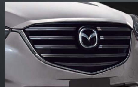
19 [KENSTYLE] ボンネットガーニッシュ