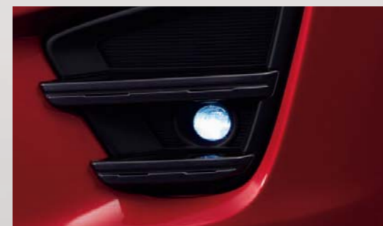
38 LEDフォグランプ フォグランプスイッチをONにすると、LEDフォグランプが発光。