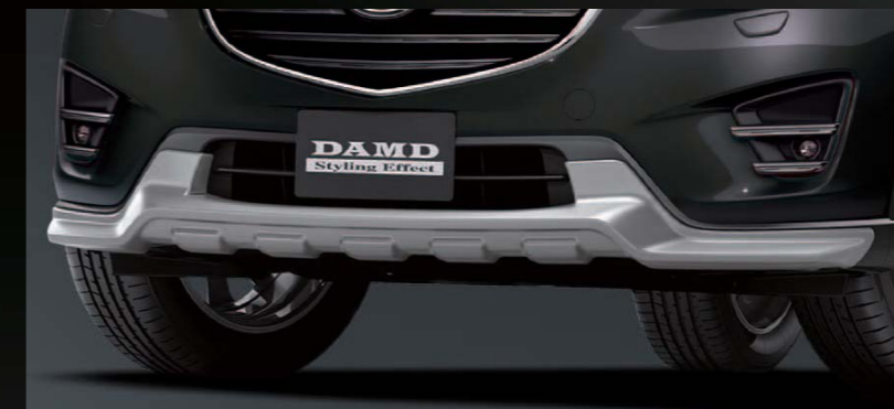
25 [DAMD] フロントプロテクター