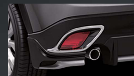
24 [KENSTYLE] リアリフレクターガーニッシュ

注意事項 ●07~12頁に掲載したカスタマイズパーツは、保安基準適合商品ですが、一般市販部品の品質基準で製作しております。●カスタマイズパーツを装着した車両では、緑石などの段差、歩道や踏切の横断時、スロープの上り下り時に、路面等と干渉する恐れがあります。●これら掲載されている商品を装着することにより、乗り心地・走行性能・風切音・排気音等、装着前の標準車本来の状態から変化する場合がありますので、あらかじめご了承ください。●掲載画像は実際の商品・色とは異なって見える場合があります。●商品に関する不明な点は、販売店またはマツダ(株)コールセンターまでご相談ください。