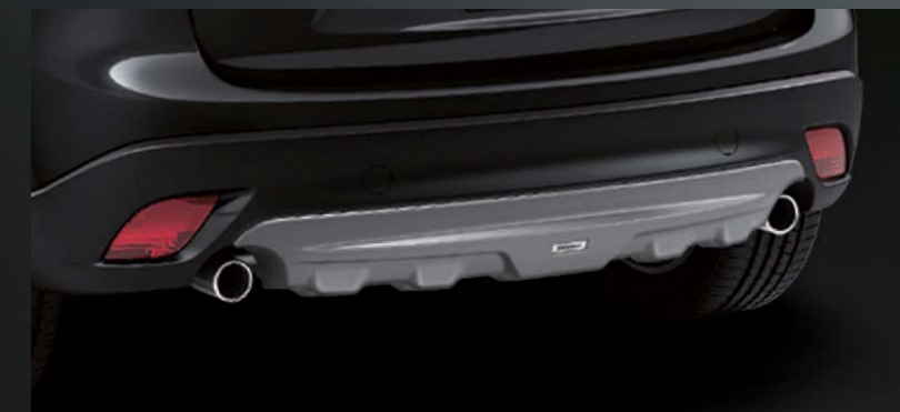
26 [DAMD] リアアンダープロテクター