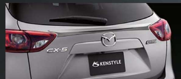
23 [KENSTYLE] リフトゲートガーニッシュ