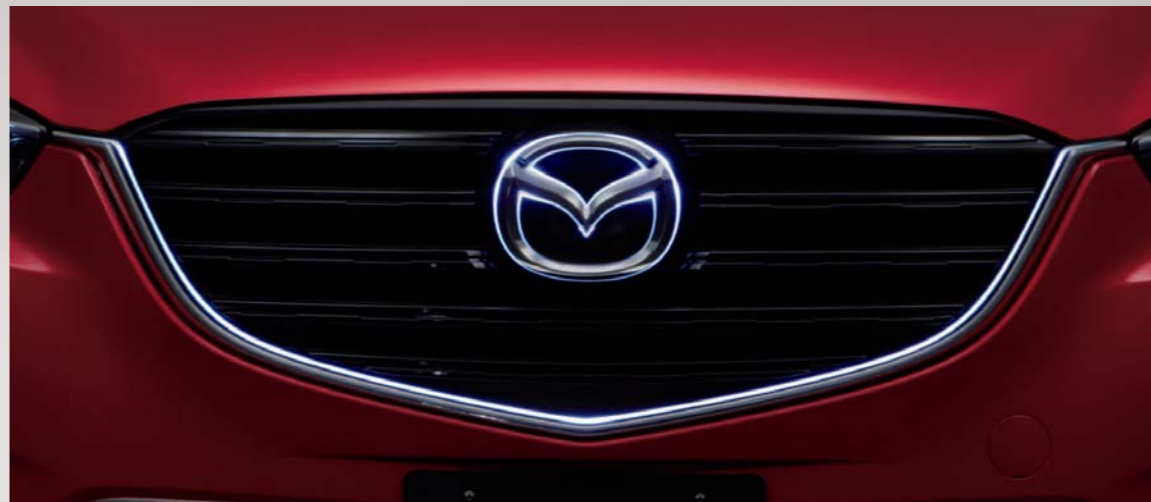
36 シグネチャーウイングイルミネーション 夜間時、スモールライトと連動してシグネチャーウイングを浮かび上がらせるように発光し、魂動デザインをアピール。照明色:ホワイト

※掲載価格は消費税(8%)込価格です。 3年6万km保証 マツダ純正アクセサリは、3年6万km保証付です。 ※ただし、一部用品とマツダスピード/Mz Custom/DAMD/KENSTYLE用品および消耗品は除きます。また消臭や 水等の特殊機能については保証対象外です。保証期間は右記マークで表示しております。 3年6万km保証 3年6万km保証付 1年2万km保証 1年2万km保証付