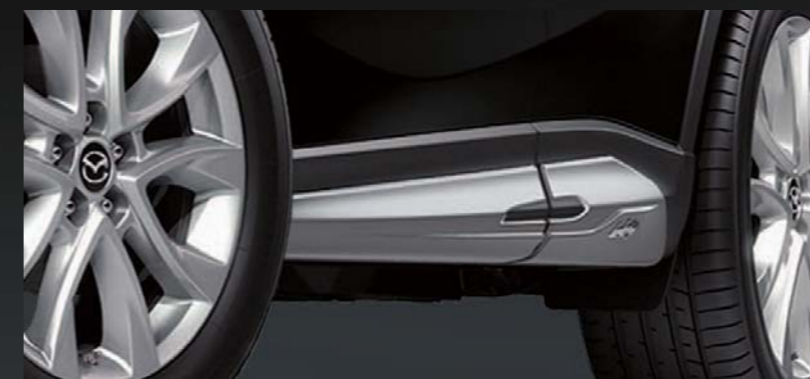
28 [DAMD] サイドプロテクター